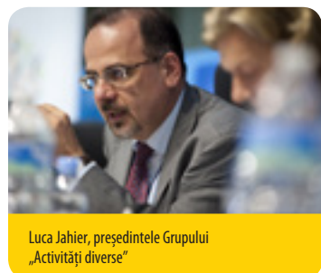
Luca Jahier, președintele Grupului „Activități diverse”

La treizeci de ani de la definirea conceptului de dezvoltare durabilă, viitorul nostru comun este pus efectiv în pericol. Într-un moment în care alții își reneagă angajamentele, este imperativ ca UE să își mențină dinamica, asumându-și schimbarea , accelerându-i ritmul și investind în ea. Momentul este prielnic pentru un angajament pe termen lung, spre a asigura tranziția la o economie favorabilă incluziunii, echitabilă, rezilientă, cu emisii scăzute de dioxid de carbon, circulară și colaborativă. A venit vremea ca liderii politici să regândească modelele noastre de creștere economică și să îmbunătățească calitatea vieții cetățenilor. Acum trebuie găsit un echilibru între prosperitatea economică, inovare, incluziunea socială, participarea democratică și durabilitatea mediului, în interiorul frontierelor noastre globale.