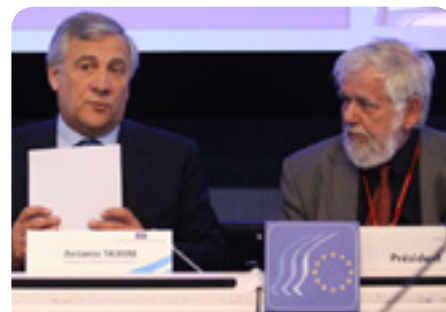
Președintele PE, Antonio Tajani, alături de președintele CESE, Georges Dassis

Președintele PE, dl Antonio Tajani, a participat la sesiunea plenară a CESE joi, 1 iunie, pentru a discuta despre prioritățile PE și consolidarea cooperării dintre cele două instituții.