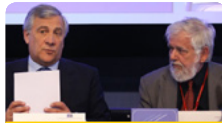
Il-President tal-PE Antonio Tajani mal-President tal-KESE Georges Dassis

"It-tliet sfidi ewlenin li jeħtieġ li naħdmu flimkien fuqhom huma l-qgħad (speċjalment il-qgħad fost iż-żgħażaġh), il-migrazzjoni u t-terroriżmu," qal is-Sur Tajani.