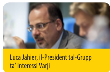
Luca Jahier, il-President tal-Grupp ta' Interessi Varji

Tletin sena wara d-definizzjoni tal-kunċett tal-iżvilupp sostenibbli, il-futur komuni tagħna huwa mhedded sew. Fi żmien meta l-ohrajn qed jagħtu daharhom lill-impjenji tagħhom, huwa essenzjali li l-UE żżomm il-momentum , filwaqt li taċċellera u tinvesti fil-bidla u tilqagħha . Issa wasal iż-żmien għal impenn fit-tul, biex issir it-tranzizzjoni lejn soċjetà inkluziva, ewka, reżiljenti, b'livell baxx ta' karbonju, ċirkolari u kollaborattiva. Issa huwa ż-żmien għal tmexxija politika , biex jerġgħu jiġu kkunsidrati l-mudelli ta' tkabbir tagħna u jitejjeb il-benesseri. Dan sabiex il-prospertà ekonomika tiġi bbilanċjata mal-innovazzjoni, l-inkluzjoni soċjali, il- partecipazzjoni demokratika u s-sostenibbiltà ambjentali, kollha fi hdan il-fruntieri globali tagħna. Għandu jkollna l-konvinzjoni u l-kuraġġ niddefendu id-dimensjonijiet universali,