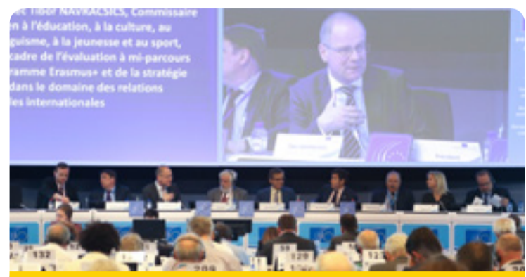
Dibattitu tal-plenarja mal-Kummissarju Navracsics (fin-nofs) u r-relatur Luca Jahier (l-ewwel mil-lemin)

L-UE teħtieġ pjan konkret biex tippromovi l-kultura bħala element essenzjali f'soċjetajiet miftuħa u tolleranti. Il-KESE kellu dibattitu mal-Kummissarju Navracsics u vvota permezz tal-Opinjoni tiegħu