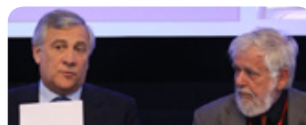
Predsjednik EP-a Antonio Tajani s predsjednikom EGSO-a Georgesom Dassisom

Predsjednik EP-a Antonio Tajani sudjelovao je na plenarnoj sjednici EGSO-a u četvrtak, 1. lipnja radi rasprave o prioritetima EP-a i jačanju suradnje između dviju institucija.