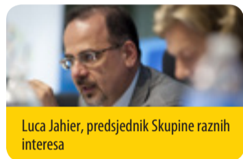
Luca Jahier, predsjednik Skupine raznih interesa

Trideset godina nakon definiranja pojma „održiv razvoj“ naša zajednička budućnost u velikoj je opasnosti. U trenutku kad drugi okreću leđa obvezama koje su preuzeli, od presudne je važnosti da EU zadrži zamah , uz ubrzavanje i spremno prihvaćanje promjena te ulaganje u njih. Sada je trenutak za preuzimanje dugoročnih obveza za prijelaz na uključivo, pravedno, otporno, niskouglično, kružno i suradničko gospodarstvo. Sada je trenutak za preuzimanje političkog vodstva , preispitivanje naših modela rasta i povećanje blagostanja kako bi se uspostavila ravnoteža između ekonomskog prosperiteta i inovacija, socijalne uključenosti, demokratskog sudjelovanja i ekološke održivosti – sve to u okviru naših globalnih granica. Moramo iskazati dovoljno uvjerenja