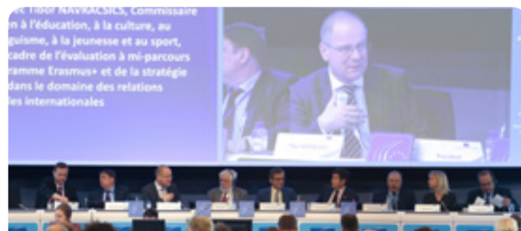
Plenarna rasprava s povjerenikom Navracsicsom (u sredini) i izvjestiteljem Lucom Jahierom (prvi s desna)

EU-u je potreban konkretan plan za poticanje kulture kao jednog od temeljnih elemenata otvorenih i tolerantnih društava. EGSO je održao raspravu s povjerenikom Navracsicsom te je glasovanjem usvojio mišljenje