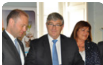
Premijer Malte Joseph Muscat i predsjednik Skupine poslodavaca Krawczyk odmah nakon svečanosti potpisivanja

„ Poduzećima treba omogućiti slobodu djelovanja, te pozivamo na pravnu, regulatornu i političku stabilnost u cilju privlačenja dugoročnih ulaganja “, izjavio je Jacek P. Krawczyk , predsjednik Skupine poslodavaca EGSO-a. „ Naša gospodarstva vape za većom slobodom. Moramo odgovorno rasteretiti i liberalizirati naše strategije ulaganja “, dodao je Joseph Muscat , premijer Malte.