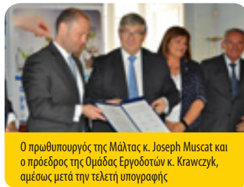
Ο πρωθυπουργός της Μάλτας κ. Joseph Muscat και ο πρόεδρος της Ομάδας Εργοδοτών κ. Krawczyk, αμέσως μετά την τελετή υπογραφής

«Οι επιχειρήσεις πρέπει να λειτουργούν ελεύθερα, και τασσομάστε υπέρ της νομικής, ρυθμιστικής και πολιτικής σταθερότητας με στόχο την προσέλκυση μακροπρόθεσμων επενδύσεων», δήλωσε ο κ. Jacek P. Krawczyk , πρόεδρος της Ομάδας Εργοδοτών της ΕΟΚΕ. «Οι οικονομίες κάνουν έκκληση για μία «ανάσα». Είναι αναγκαίο να απελευθερώσουμε και να