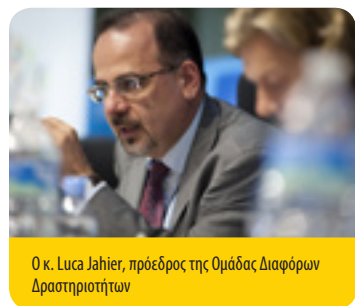
Ο κ. Luca Jahier, πρόεδρος της Ομάδας Διαφόρων Δραστηριοτήτων

Τριάντα χρόνια αφότου ορίστηκε η έννοια της βιώσιμης ανάπτυξης, το κοινό μας μέλλον απειλείται πλέον σοβαρά. Σε μια περίοδο κατά την οποία άλλοι αθετούν τις δεσμεύσεις τους, η ΕΕ πρέπει οπωσδήποτε να διατηρήσει την κερκτημένη ταχύτητα , να επιταχύνει, να συνεχίσει να επενδύει και να ενστερνίζεται τις αλλαγές . Πλέον ήρθε η ώρα να αναλάβουμε τη μακροχρόνια δέσμευση να μεταβούμε σε μια περιεκτική, δίκαιη, ανθεκτική, κυκλική και συνεργατική οικονομία χαμηλών ανθρακούχων εκπομπών. Ήρθε η ώρα να επανεξετάσει η πολιτική ηγεσία τα αναπτυξιακά υποδείγματα και να μεριμνήσει για τη βελτίωση της ευημερίας. Ήρθε η ώρα να πετύχουμε την εξισορρόπηση της οικονομικής ευημερίας με την καινοτομία, την κοινωνική ένταξη, τη συμμετοχή στα κοινά και την περιβαλλοντική βιωσιμότητα, εντός των παγκόσμιων συνόρων μας. Πρέπει να