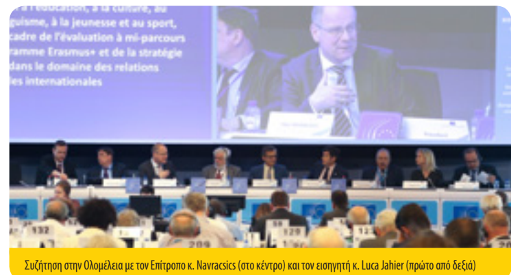
Συζήτηση στην Ολομέλεια με τον Επίτροπο κ. Navracsics (στο κέντρο) και τον εισηγητή κ. Luca Jahier (πρώτο από δεξιά)

Η ΕΕ χρειάζεται ένα συγκεκριμένο σχέδιο για την προαγωγή του πολιτισμού ως ζωτικής συνιστώσας ανοικτών και ανεκτικών κοινωνιών. Η ΕΟΚΕ πραγματοποίησε συζήτηση με τον Επίτροπο κ. Navracsics και προέβη σε ψηφοφορία σχετικά με τη στρατηγική της ΕΕ για διεθνείς πολιτιστικές σχέσεις, μέσω της γνωμοδότησης της επί του θέματος.