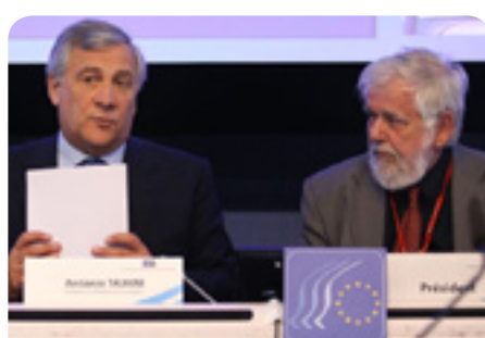
Ο Πρόεδρος του Ευρωπαϊκού Κοινοβουλίου κ. Antonio Tajani με τον Πρόεδρο της ΕΟΚΕ κ. Γιώργο Ντάση

Ο Πρόεδρος του ΕΚ Antonio Tajani συμμετείχε στη σύνοδο ολομέλειας της ΕΟΚΕ την Πέμπτη 1 Ιουνίου για να συζητήσει τις προτεραιότητες του ΕΚ και την ενίσχυση της συνεργασίας μεταξύ των δύο οργάνων.