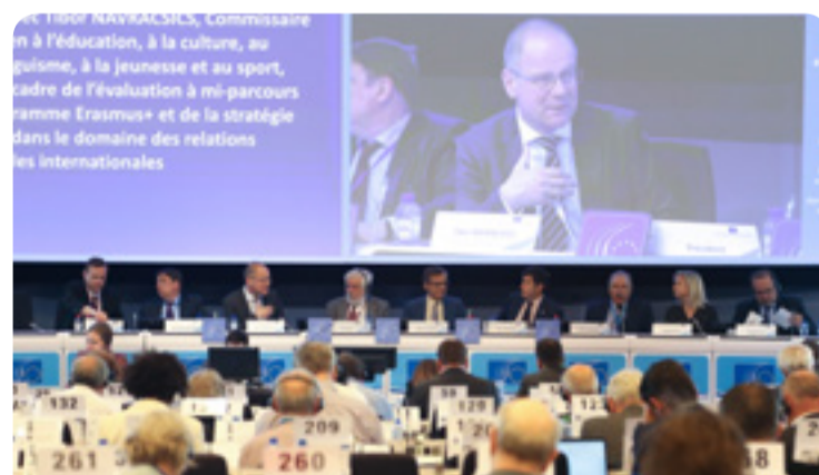
Diskuse na plenárním zasedání s komisařem Navracsicsem (uprostřed) a zpravodajem Lucou Jahierem (první zprava)

EU potřebuje konkrétní plán, aby mohla propagovat kulturu coby zásadní prvek otevřené a tolerantní společnosti. EHSV na toto téma diskutoval s komisařem Navracsicsem a přijal své