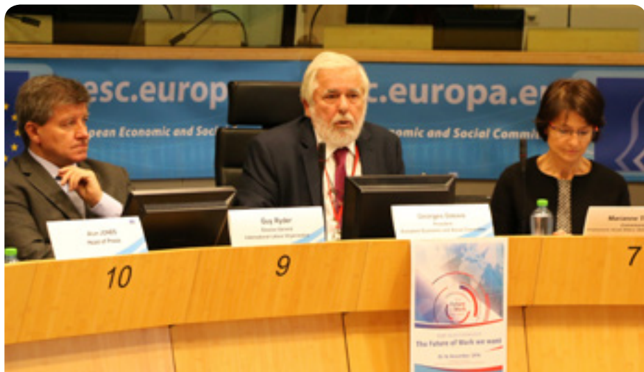
Od leve proti desni: generalni direktor MOD Guy Rider, predsednik EESO Georges Dassis in evropska komisarka Marianne Thyssen med tiskovno konferenco o prihodnosti dela

EESO in Mednarodna organizacija dela (MOD) sta 15. in 16. novembra 2016 v Bruslju organizirala dialog na visoki ravni na temo prihodnosti dela . Udeležilo se ga je več kot 300 predstavnikov evropskih socialnih partnerjev ter civilne družbe. Otvorilne nagovore so imeli predsednik EESO Georges Dassis, pred kratkim ponovno izvoljeni generalni direktor MOD Guy Ryder in evropska komisarka Marianne Thyssen.