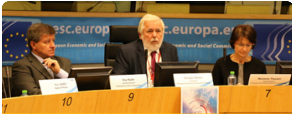
Vasemmalta oikealle: ILO:n pääjohtaja Guy Ryder, ETSK:n puheenjohtaja Georges Dassis ja EU-komissaari Marianne Thyssen "Työn tulevaisuus" kampanjan lehdistötilaisuudessa.

ETSK ja Kansainvälinen työjärjestö (ILO) järjestivät 15.–16. marraskuuta 2016 Brysselissä korkean tason vuoropuhelun aiheesta "Työn tulevaisuus". Se keräsi yhteen yli 300 osallistujaa, jotka edustivat Euroopan työmarkkinaosapuolia ja kansalaisyhteiskuntaa. ETSK:n puheenjohtaja Georges Dassis, äskettäin uudelleen valittu ILO:n pääjohtaja Guy Ryder ja Euroopan komission jäsen Marianne Thyssen käyttivät avausistunnossa puheenvuoron.