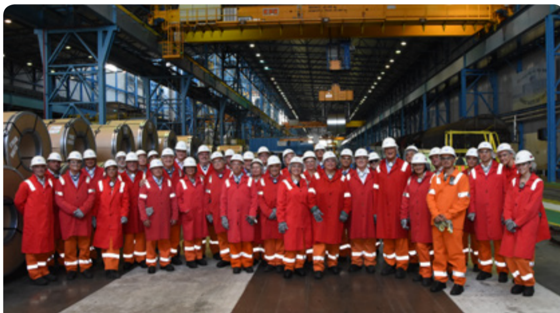
Il-konferenza kienet koorganizzata mill-Grupp ta' Min Ihaddem u l-Unjoni Nazzjonali tal-Impjegaturi tas-Slovakkja

European Economic and Social Committee Európsky hospodársky a sociálny výbor