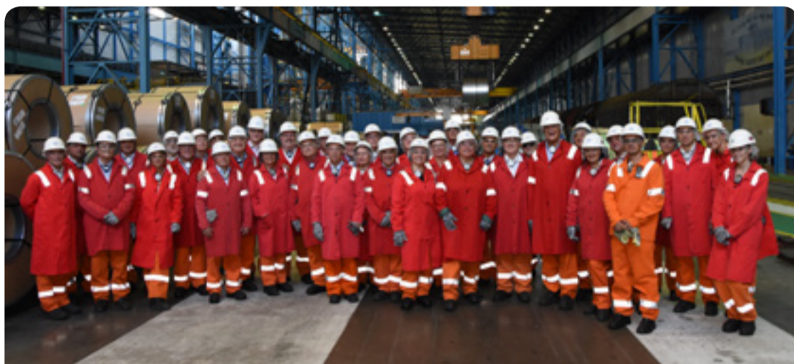
Darbdavių grupės kartu su Slovakijos nacionaline darbdavių sąjunga surengta konferencija

European Economic and Social Committee Európsky hospodársky a sociálny výbor