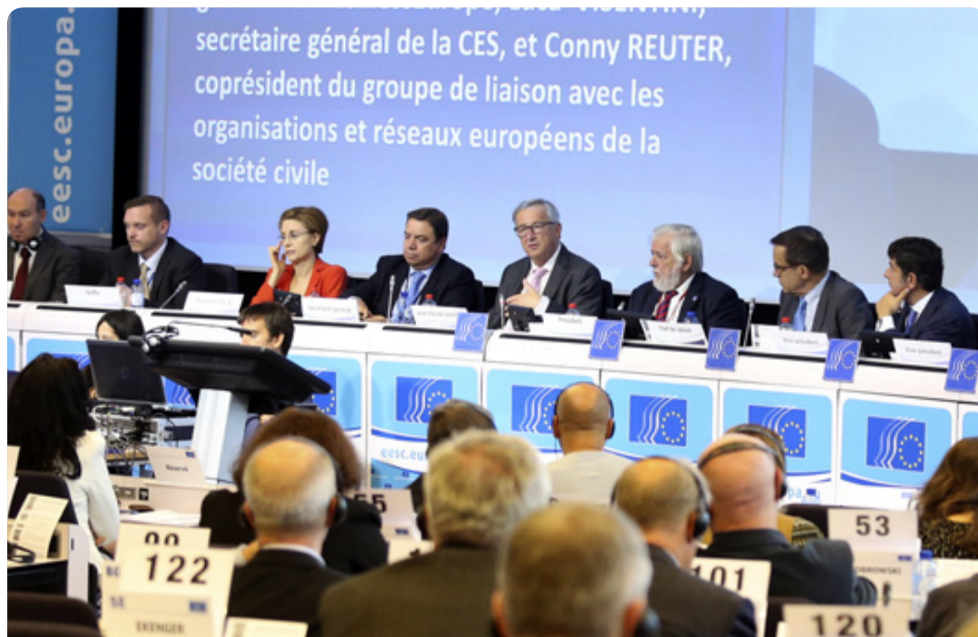
Il Presidente della Commissione europea Jean-Claude Juncker e il Presidente del CESE Georges Dassis durante il dibattito alla plenaria del CESE

Il CESE ha un importante ruolo istituzionale da svolgere nei negoziati sul TTIP. L'obiettivo del parere adottato è quello di sviluppare un approccio cooperativo alla politica commerciale tra la Commissione europea e la società civile. (mm)