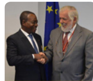
Stretta di mano tra il Presidente del CESE Georges Dassis e il Presidente del CES della Costa d'Avorio Charles Koffi Diby

L'incontro, che è stato un'occasione per un proficuo scambio di vedute su questioni di interesse comune, è sfociato nella decisione di sviluppare una serie di attività congiunte. Dassis ha sottolineato la disponibilità del Comitato a fornire consulenza al CES della Costa d'Avorio su questioni relative al proprio funzionamento e a condividere la propria esperienza riguardo all'impatto dei consigli economici e sociali,