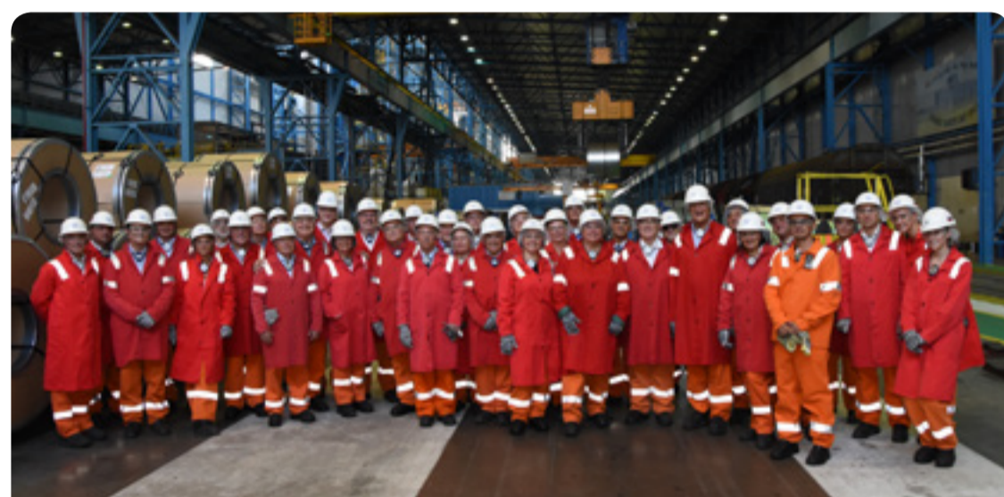
La conferencia fue organizada conjuntamente por el Grupo de Empresarios y la Unión Nacional de Empresarios de Eslovaquia

También queremos manifestar nuestro pleno apoyo a todos los trabajadores, organizaciones sindicales, políticos e inversores que se están movilizando para garantizar un futuro a esta región ya duramente golpeada por una crisis que ha sumido a toda la zona en una situación precaria. ●