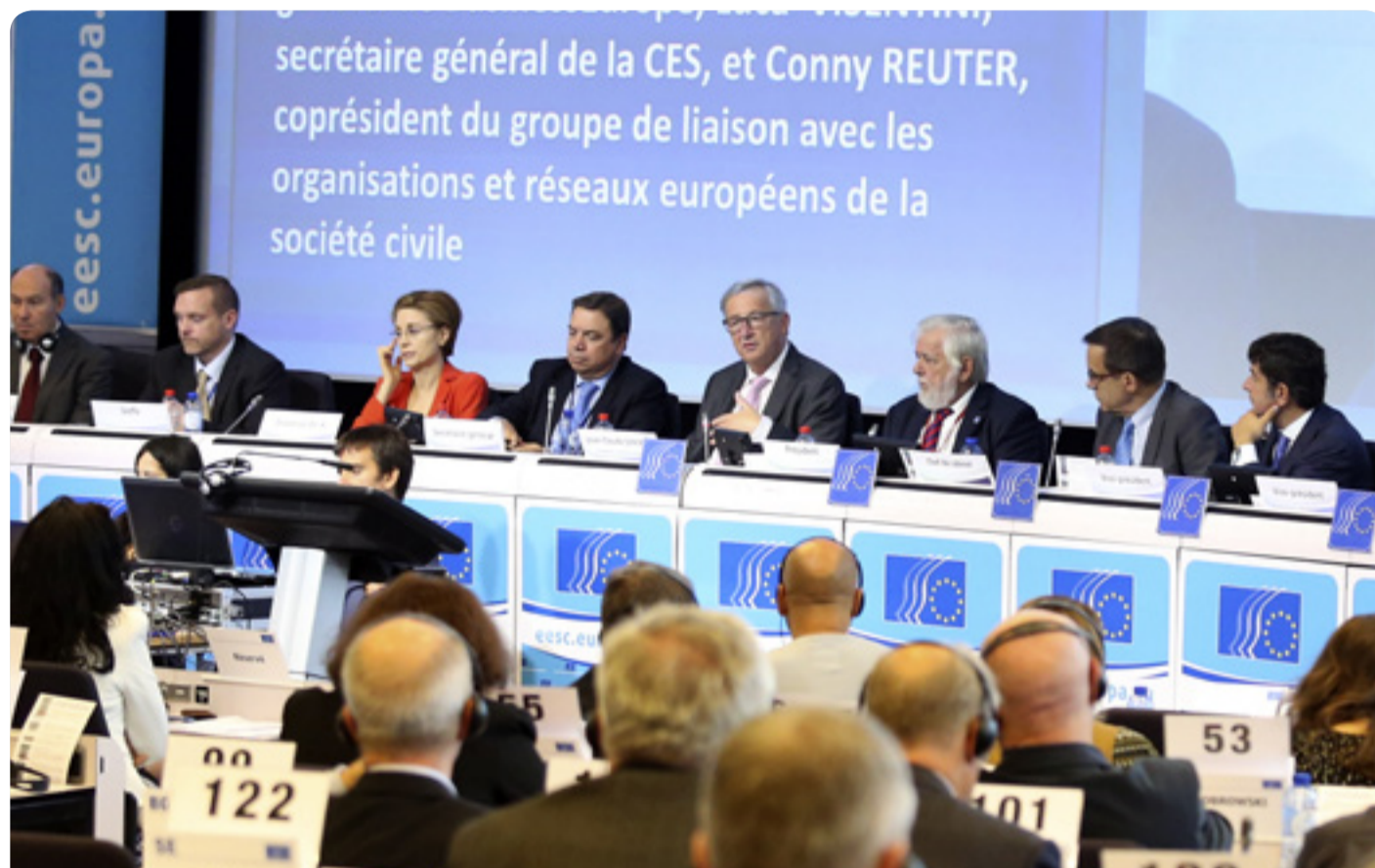
El presidente de la Comisión Europea, Jean-Claude Juncker, y el presidente del CESE, Georges Dassis, durante el debate en el pleno del CESE

El CESE tiene un importante papel institucional que desempeñar en las negociaciones de la ATCI. El objetivo de este dictamen es desarrollar un planteamiento cooperativo de la política comercial entre la Comisión Europea y la sociedad civil. (mm)