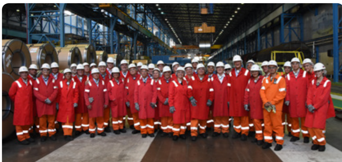
Конференцията беше организирана съвместно от група „Работодатели“ и Националния съюз на работодателите в Словакия

European Economic and Social Committee Európsky hospodársky a sociálny výbor