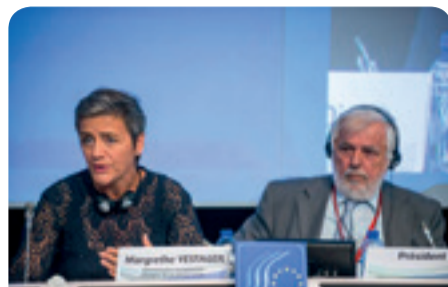
Komisárka EÚ pre hospodársku súťaž Margrethe Vestager a predseda EHSV Georges Dassis

Členovia EHSV vyjadrili podporu politike, ktorú komisárka vyvíja, a poukázali na súčasné problémy v oceliarskom a železničnom odvetví v súvislosti s Čínou. Témami diskusie boli aj sociálny dumping,