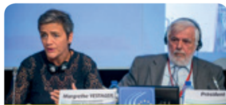
Margrethe Vestager, comissária europeia responsável pela Concorrência, e Georges Dassis, presidente do CESE

Os membros do CESE manifestaram o seu apoio à política seguida pela Comissária Margrethe