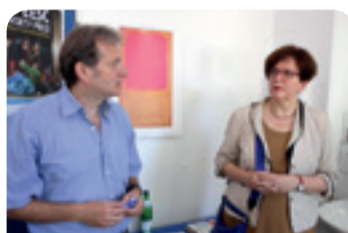
Gabriele Bischoff, az EGSZB „Munkavállalók” csoportjának elnöke az EGSZB 2015. évi civil társadalmi díjának nyertesénél, az „Armut und Gesundheit in Deutschland” szervezetnél tett látogatása során

A szegénység számos formát ölthet: munkanélküliség, hajléktalanság, a tanulási lehetőségek hiánya vagy alacsony színvonal, anyagi korlátok, rossz egészségi állapot stb. A szegények egészségének javítását tűzte ki célul Gerhard Trabert professzor, a fenti mainzi szövetség alapítója és igazgatója. Ennek keretében mozgóklinikájával látogatja sorra a hajléktalanokat és a szociálisan hátrányos helyzetűeket. A szövetség bokros teendői közé tartozik továbbá a szociális ügyekben – főként a társadalombiztosítással és a társadalomba való (új)beilleszkedéssel kapcsolatos kérdésekben – történő tanácsadás. Gabriele Bischoff már sok szomorú történetet hallott, gyakran olyan munkavállalókról, akiket „színelte önfoglalkoztatónak”, hamis jogcímen alkalmaztak, és akik nem tudták, hogy nem rendelkeztek biztosítással. „A munkavállalók szabad mozgása az EU egyik legfontosabb alapelve” – tűzte hozzá –, „azonban elfogadhatatlan,