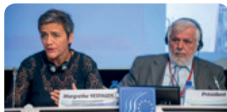
Margrethe Vestager versenypolitikáért felelős európai biztos és Georges Dassis, az EGSZB elnöke

Az EGSZB tagjai támogatásukról biztosították a Vestager biztos által követett politikát, továbbá felhívták a figyelmet az acéltipar és a vasúti ágazat aktuális