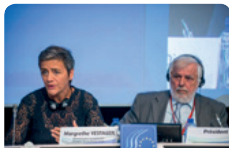
Margrethe Vestager, povjerenica EU-a za tržišno natjecanje, s Georgesom Dassisom, predsjednikom EGSO-a

Članovi EGSO-a izrazili su podršku politici koju provodi povjerenica Vestager te istaknuli aktualna pitanja u pogledu Kine na području čelika