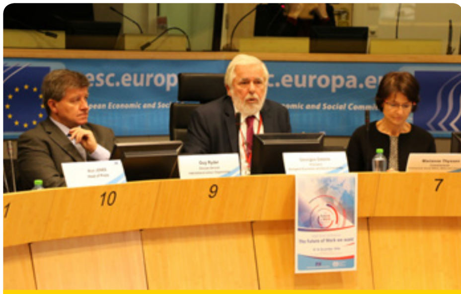
Von links nach rechts: ILO-Generaldirektor Guy Ryder, EWSA-Präsident Georges Dassis und EU-Kommissarin Marianne Thyssen auf der Pressekonferenz zur Zukunft der Arbeit

Am 15./16. November 2016 führten der EWSA und die Internationale Arbeitsorganisation (ILO) in Brüssel einen hochrangigen Dialog über die Zukunft der Arbeit . Daran nahmen über 300 Vertreter der europäischen Sozialpartner und der Zivilgesellschaft teil. EWSA-Präsident Georges Dassis, der kürzlich wiedergewählte ILO-Generaldirektor Guy Ryder und Kommissionsmitglied Marianne Thyssen ergriffen in der Eröffnungssitzung das Wort.