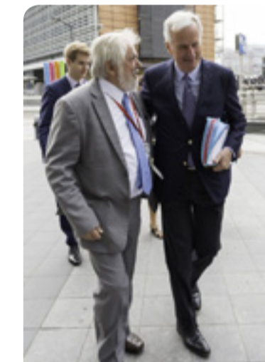
Michel Barnier , az EU brexit-főtárgyalója Georges Dassis EGSZB-elnökkel

Abban mindenki egyetértett, hogy bár a brexit fontos és az előnyös megállapodás mindkét fél érdeke, a legfontosabb mégis Európa jövője. „Tudatosítanunk kell az emberekben, hogy az uniós tagság számtalan előnnyel jár. A brexit világosan megmutatta, hogy nagyon sokan nincsenek tisztában azzal, hogy ezek az előnyök éppen az uniós tagságból adódnak. Az Egyesült Királyságban sokan csak most kezdenek ráébredni erre. Most az európai érdekeltek feladata, hogy a 27 tagú EU-t